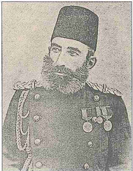
Gazi Edhem Paşa

Edhem Paşa'nın kabiliyet ve karakteri hususunda bazı yabancı askerî erkân olumsuz görüş belirtmişler; herkesin iyiliğini isteyen, hâkimiyet kurmaya çalışan ve tedbirli davranan bir yapıya sahip olmaktan ziyade çekingen ve gelecekte endişe eden biri olduğunu söylemişlerdir. Gerçekte ise Edhem Paşa cesur, tecrübeli, tedbirli ve temkinli, harp usulünü bilen, kumanda sorumluluğuna sahip bir askerdir. Kumanda yetene-