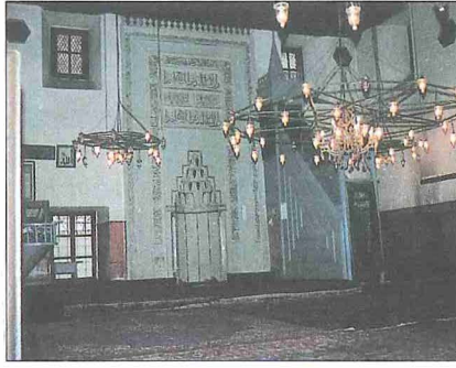
Hacı İlyas Camii'nin içinden bir görünüşü

Gerek zemindekilerin gerekse üstte kaldınlar için yapılmış ahşap direkler üzerine oturan mahfillerinin korkulukları sanat bakımından dikkate değer bir özellik taşımaz. Ancak harimin girişi üstünde mavi zeminli, sarı kûfî yazılı bir çini pano dikkat çekicidir. Caminin mimarisinin sa-