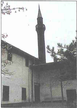
Hacı İlyas Camii - Hacettepe / Ankara