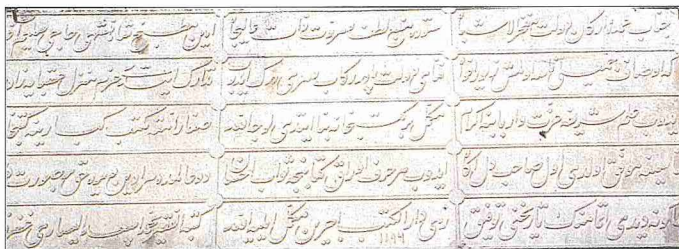
Hacı Selim Ağa Kütüphanesi'nin kitâbesi