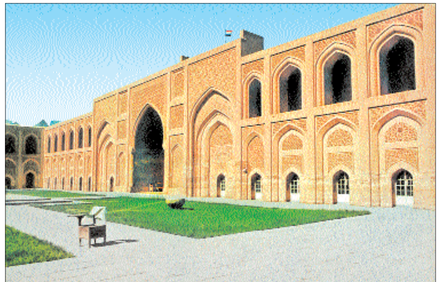
Müstansiriyye Medresesi'nin avlusundan bir görünüş

Girişin tam karşısında 21,50 m. uzunluğunda, 6,50 m. genişliğinde, ortadaki daha büyük üç kemerle avluya açılan uzun oda, mihrap olarak düzenlenmiş nişten de anlaşılacağı gibi mescid olarak planlanmıştır. Alt katta kibleye göre mescidin sağındaki bölüm Şâfiîler'e, solundaki bölüm Hanefîler'e tahsis edilmişti. Taçkapıdan girildiğinde sağdaki bölüm Hanbelîler'e, Hanefîler'in karşısına düşen soldaki bölüm ise Mâlikî mezhebi mensuplarına ayrılmıştı. Dikdörtgen avlunun dar kenarlarının ortalarında yer alan eyvanlardan doğudaki Hanefîler'e, batıdaki Şâfiîler'e aitti. Avluya açılan eyvanların genişliği 6 m., uzunluğu 7,80 m. olup tavanları iki katın yüksekliğine ulaşmakta ve cephesi bina seviyesini biraz aşmaktaydı. Her katta otuz dokuz küçük oda, ayrıca orta büyüklükte birkaç oda ile çeşitli ölçülerde çapraz tonozlu çatısında ışık ve hava için penceresi olan yüksek tavanlı on iki büyük oda bulunmaktaydı. Girişin sağında ve solunda motifli tuğlalarla süslenmiş avluya açılan birer küçük eyvanın hemen yanlarından iki, mescidin sağ ve solundan iki, Şâfiî eyvanının iki yanındaki odalardan sonra birer olmak üzere zeminden üst kata çıkmak için altı adet merdiven mevcuttu. Buradan avluya bakan pencerelerden ışık alan revak şeklindeki koridorlara çıkılırdı. Öğrencilerin ikamet için yapılmış odaların kapıları bu koridora açılmaktaydı. Binanın doğu bölümünde Hanefîler'e tahsis edilen eyvanın