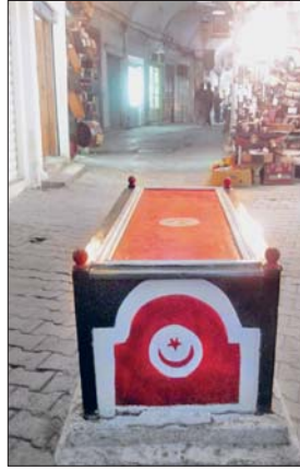
Abdullah et-Tercümân'ın Bâbüminâre'deki türbesi ile taş sandukası

rak hükümdarın bütün seferlerine katıldı. Müstansır'ın 1394 yılında vefatıyla yerine geçen oğlu Ebû Fâris Abdülazîz babasının ona tanıdığı imkânları tanıdığı gibi tekelin idaresini de kendisine verdi.