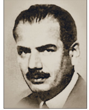
Ruşen Eşref Ünaydın